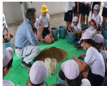
5年 バケツ稲植え JA 深川支所の皆様