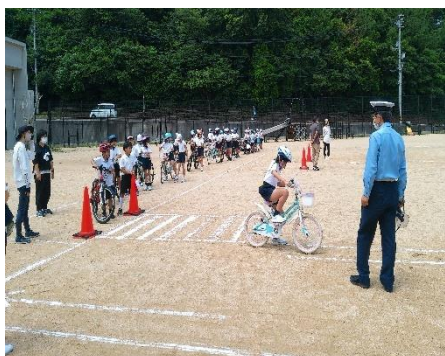
3年 自転車教室 長門警察署の皆様