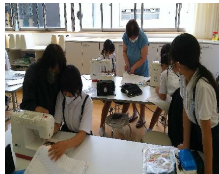
6年 ナップザック作り ちくちくクラブ・ キルトサークルゆうの皆様