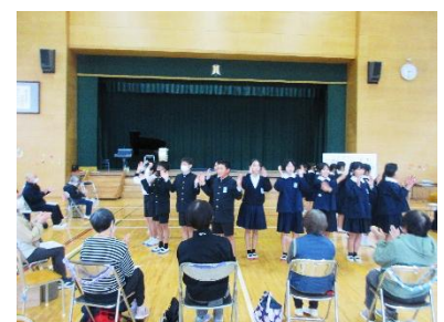
【6年 お年寄りとの交流会】 深川老人クラブの皆様