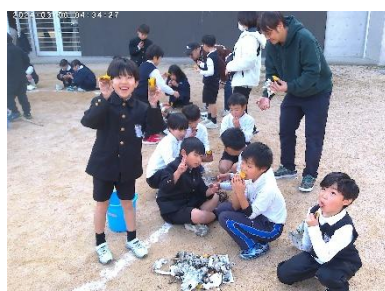
【2年 焼き芋・おもちゃランド】 保護者の皆様