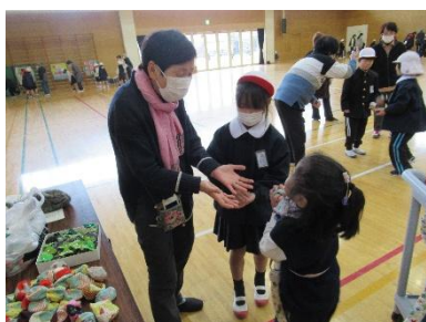
【1年 昔遊び】 中央交流プラザ・地域の皆様

2学期も地域・保護者の皆様のご協力により充実した活動を行うことができました。今後とも、子どもたちの成長を共に見守っていただきますよう、ご支援・ご協力をよろしくお願いします。