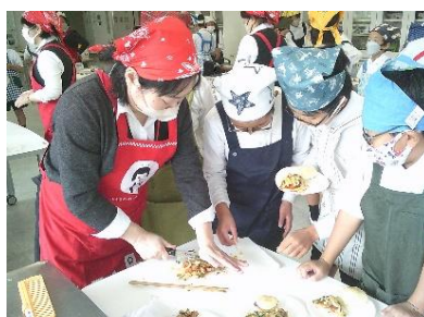
【5年 米粉料理】 JA 深川支所の皆様