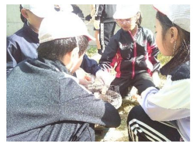
【3年 やきとり体験】 深川養鶏・やきとり連絡協議会の皆様